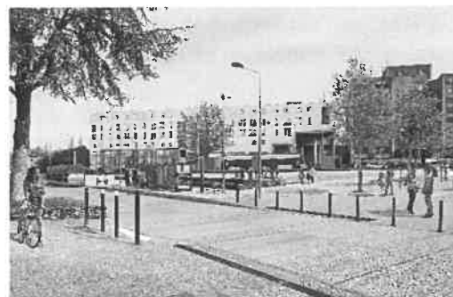
Perspective sur la station Marchais Guesdon sur la commune de Courcouronnes