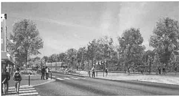
Perspective de l'aménagement du site propre route de Grigny sur la commune de Ris-Orangis

Les carrefours existants, ou créés dans le cadre du projet, seront aménagés pour assurer une insertion optimale du T Zen 4. Ces carrefours sont gérés par feux afin de donner la priorité au bus. Les giratoires sont supprimés au profit de carrefours traditionnels pour la sécurité et la fluidité des échanges.